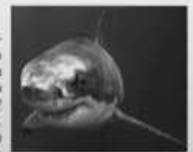
Большая белая акула

Большая белая акула — одна из самых известных видов акул. У нее 30 зубов. Средние акулы имеют самую большую рыбу — до 6 сантиметров каждый! Она использует их для того, чтобы есть морских львов и тюленей. Большая белая акула является третьей по величине среди акул — до 6 метров длиной. Эти акулы имеют уникальную особенность: они могут жить в холодной воде, что позволяет им выживать в холодных водах. Кроме температуры их тела выше температуры окружающей воды, что дает акулам больше энергии и позволяет плавать быстрее.