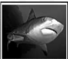
Трофейная акула с плавающей сети крохотных осьминогов умеет сморщить свой рот, что позволяет проглотить его целиком, гладкого или шероховатого. Но акулы используют язык и «удлиняют» челюсти, которые позволяют им почувствовать движение объекта задолго до того, как они коснутся его.

Чем питаются акулы, зависит от того, где и как они живут. Некоторые продолжают чередовать огромный рот крохотных плавающих животных и растения. Другие быстро плавают и хватают рыбу острыми зубами. Третьи охотятся у береговой линии на толстых, дельфинах и морских птицах. Есть еще доменные акулы, которые питаются крабами и моллюсками. Все акулы питаются другими животными.